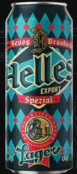
HELLES Lager 5,90 €