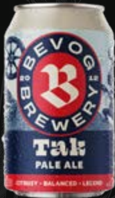
TAK Pale ale 5,50 €