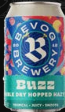
BUZZ Hazy Ipa 5,50 €