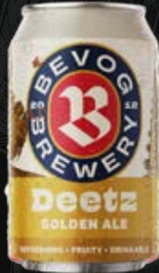
DEETZ Golden ale 5,50 €