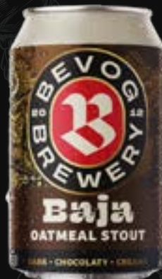
BAJA Oatmeal stout 5,50 €