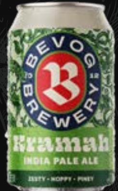
KRAMAH India Pale ale 5,50 €